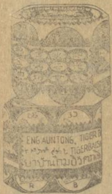
Dalem goetji ketjil merah dan poeti

Obat tjap Matjan tida boleh tida ada di toean poenja roemah, kerna tida ada obat lebih baek boeat semboehken Rheumatiek, sakit boekoe toelang dan spier, kasaleo dan pilek dari pada ini obat oemoem. Djoega boeat laen-laen penjakit dan ganggoean obat tjap Matjan ada mandjoer. Tjoba soeroe toean poenja boedjang beli boeat f 0.25 satoe goetji ketjil Obat Matjan. Toean pasti aken dapet kafaedahan dari ini.